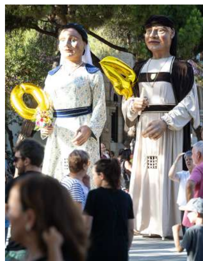
Colla Gegantera de Castelldefels