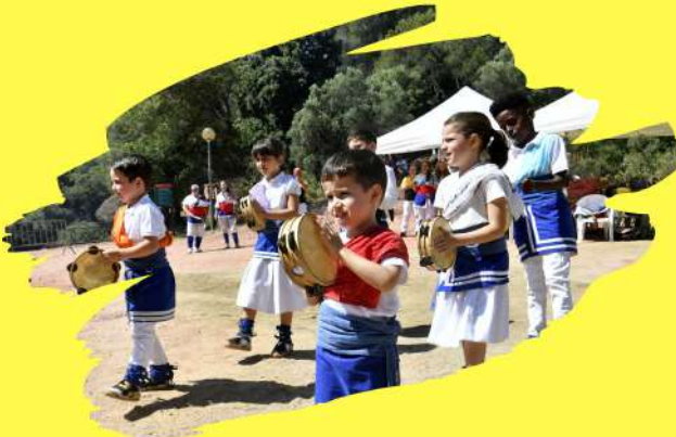
BALL DE PANDERETES