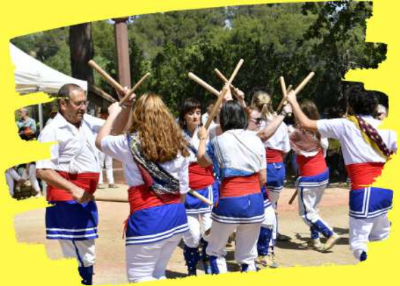
BALL DE GITANES